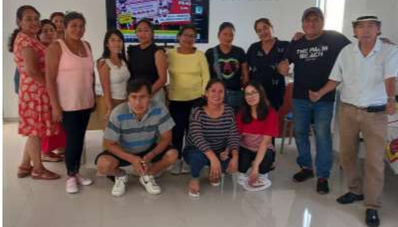
Taller de retroalimentación de la comunidad de OAT 21 de marzo del 2023